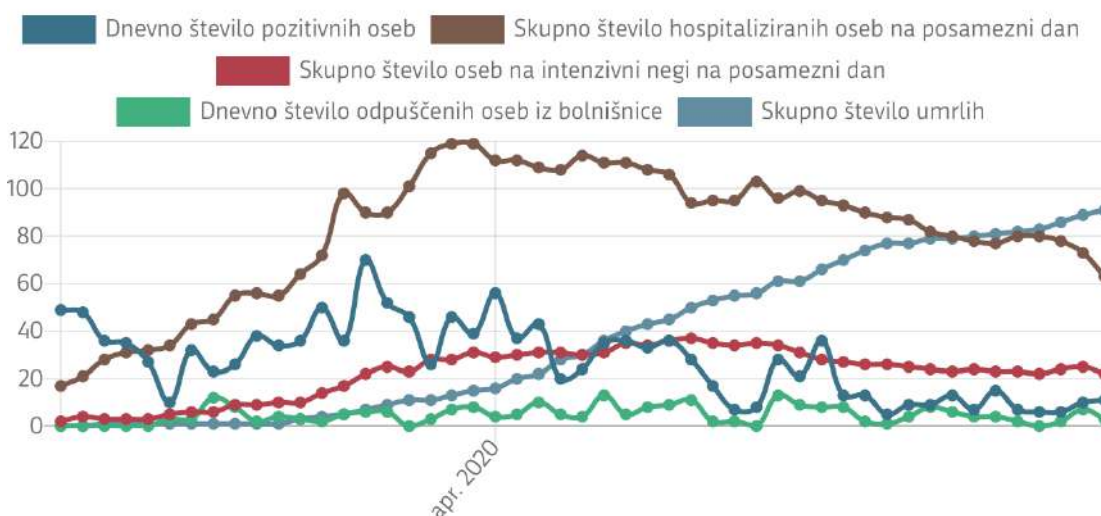
Graf 1: Prikaz števila pozitivnih oseb, hospitaliziranih oseb, oseb na intenzivni negi in oseb odpuščenih iz bolnišnične oskrbe na posamezen dan ter skupnega števila umrlih oseb

Od začetka in nekje do sredine meseca aprila beležimo največje število oseb obolenih s COVID-19 na intenzivni negi. Dne 29. 4. 2020 je na intenzivni negi 25 oseb, največ v UKC Ljubljana 12 oseb in v UKC Maribor 9 oseb.